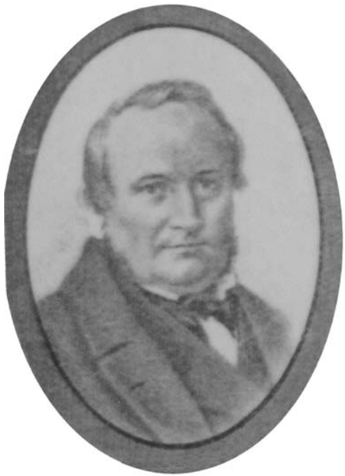
Abb. 3 Johann Georg Bogislav Müschen (1812–1897)

Patriotischen Landwirthschaftlichen Vereins unter dem Titel: „Beschreibung der älteren und neueren Kern- und Steinobstsorten, die sich sicher und mit Nutzen im nördlichen Deutschland anpflanzen lassen“. In den Jahren 1826 bis 1828 folgten weitere Teile, die auch Beschreibungen von Traubensorten und anderen Beerenfrüchten enthielten.