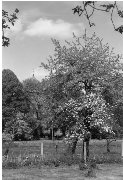
Abb. 2 Pfarrobstgarten in Belitz