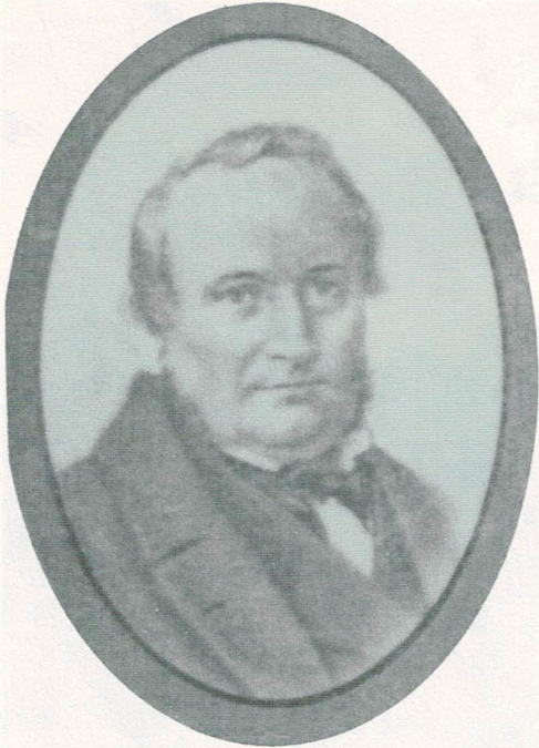
Abb. 3 Johann Georg Bogislav Müschen (1812–1897)

Patriotischen Landwirthschaftlichen Vereins unter dem Titel: „Beschreibung der älteren und neueren Kern- und Steinobstsorten, die sich sicher und mit Nutzen im nördlichen Deutschland anpflanzen lassen“. In den Jahren 1826 bis 1828 folgten weitere Teile, die auch Beschreibungen von Traubensorten und anderen Beerenfrüchten enthielten.