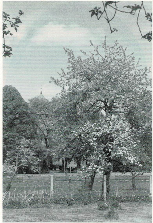
Abb. 2 Pfarrobstgarten in Belitz